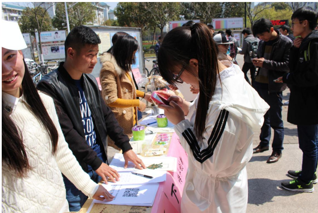
同学们扫码关注东南大学教育基金会