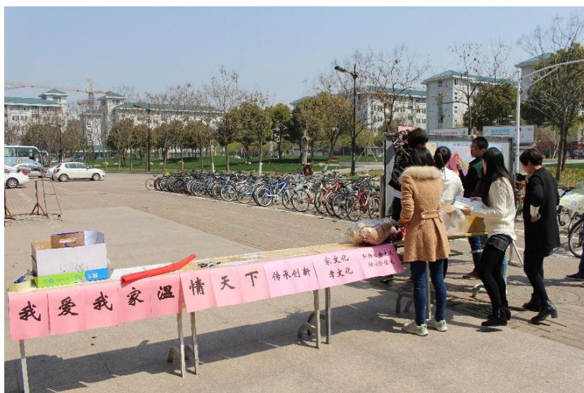
桃园餐厅活动现场布置