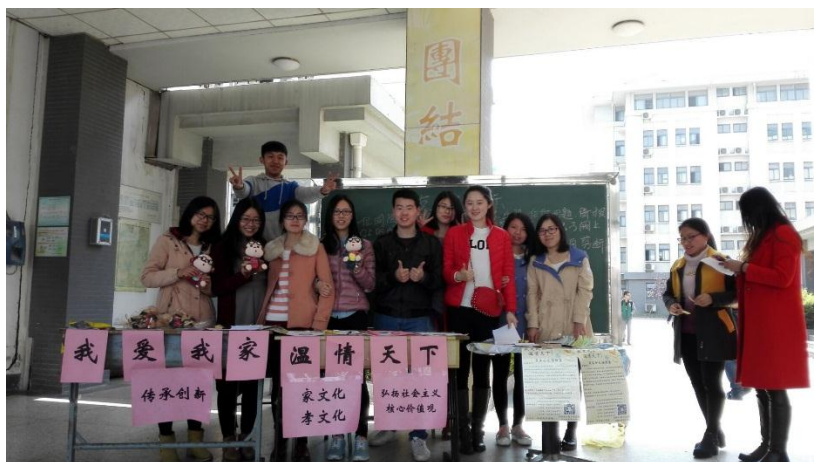
橘园现场活动合影