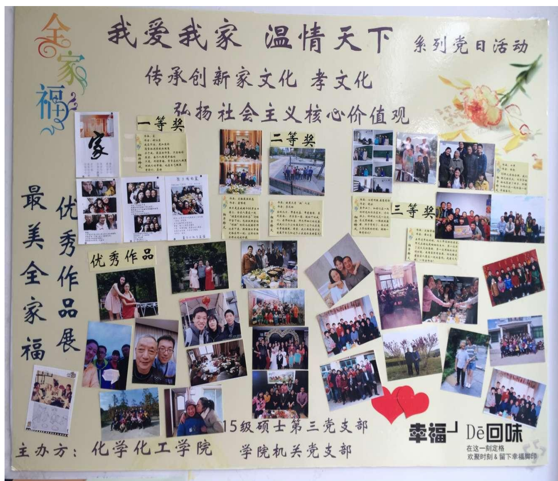
上图是我们将优秀照片打印出来做成的展板，汇聚了浓浓的爱意，充分展现了家人之间，课题组之间的美好的氛围。