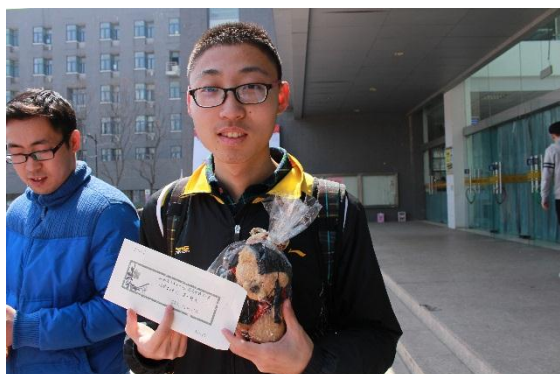
橘园大厅围观的同学