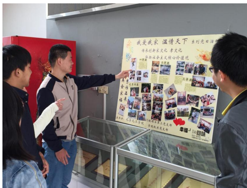
同学们观看优秀照片展板