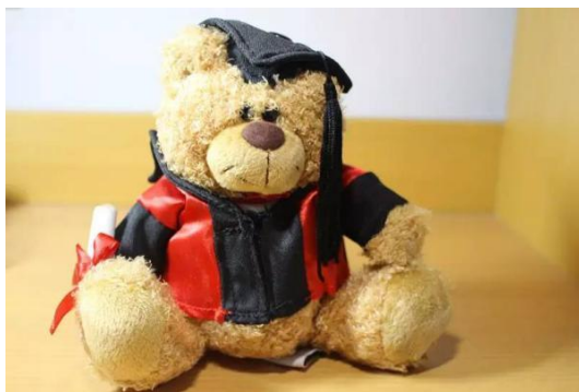
东南大学教育基金会提供的吉祥物博士熊

填写，提高大家对于孝文化的认识，增强自己的行孝意识，能够在实际行动中多与家人沟通，传播温情，传播爱。从 2016 年 3 月 14 日起，我们就开始设计问卷类型，大家集思广益，积极讨论，发表各自的意见，对问卷的类型及问题的设计提出各自的想法，最后由负责人进行收集归纳总结，我们在微信的平台上推送问卷，并通过发送填写问卷截图以及关注东南大学教育基金会二维码截图来抽取东南大学纪念博士熊的形式吸引大家参与进来，在此也特别感谢东南大学教育基金会为我们准备了丰厚的活动礼品，广大学生可以通过手机直接参与问卷调查，使用方便，操作简单。