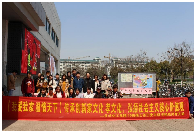
桃园现场活动合影