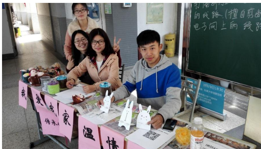
橘园大厅活动现场布置

塞入信封中交给了工作人员，由我们支部按照信封中所留的地址给大家寄回家。当场写信的同学立即获得我们提供的博士熊一只，并由我们的工作人员拍照留影。