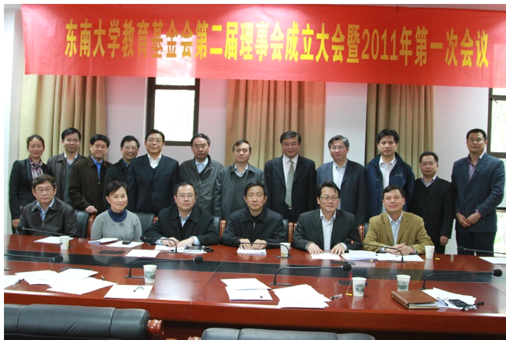
东南大学教育基金会第二届理事会成立大会参会理事、监事合影

新，争取再上一个台阶，为东南大学实现快速发展、特色发展、内涵发展、和谐发展，早日建成国际知名高水平大学贡献更大的力量。